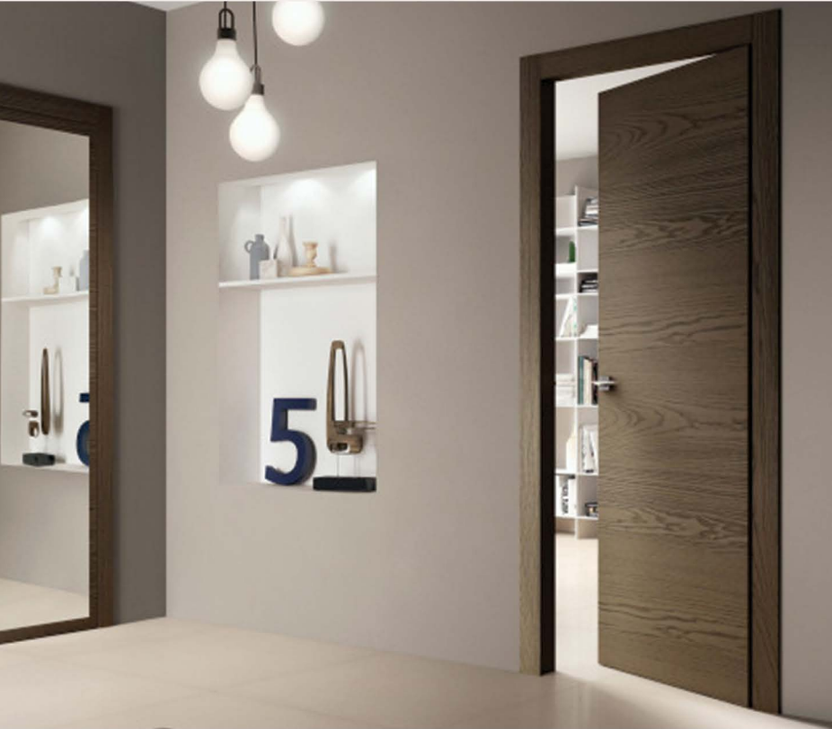
Le immagini sono fornite al solo scopo illustrativo e non costituiscono elemento contrattuale