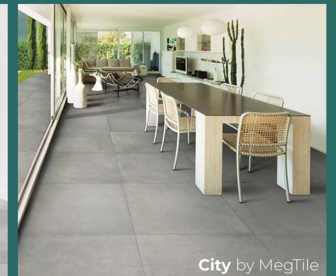
City by MegTile

Le immagini sono fornite al solo scopo illustrativo e non costituiscono elemento contrattuale