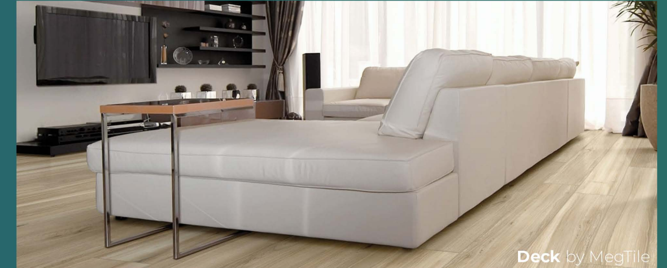
Deck by MegTile

...e molte altre. Scoprite sul capitolato!